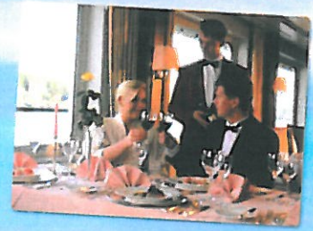
בחופשה אמת'לה ...